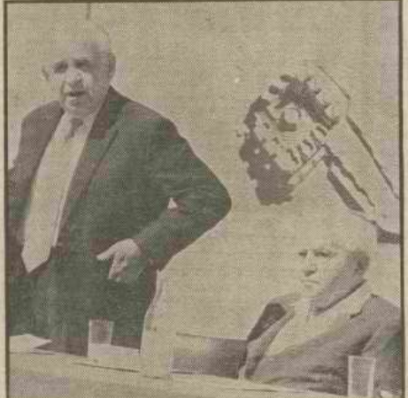
דוד בן-גוריון ז"ל (מימין) עם י.ש. שפירא ובל"א, "הייתי קשור אליו קשר נפשי"

לא. לא הייתי משוכנע, אבל הנימוקים שבן-גוריון נתן היו בעיני קלושים מאד. הוא בנה בעיקר על האופי של לבון, ניסיתי לשכנע אותו לגופו של עניין, הניסיתי גם לומר לו, פחות או יותר, שלפי שיקול-דעת אובייקטיבי, עמדתו לא התקבל על דעתם של אנשים נייטראליים, אמרתי לו שהבריות לא יצדיקו אותי, ההתווכחה הטובה ביותר ביחס לזה שאנשים אובייקטיבים ונייטראליים עשויים או עלולים לצאת נגדו, ראיתי בעצמי, שהרי לא שוכנעתי על ידו, ראה, אני הייתי לאין ערוך קשור יותר לב.ג. מאשר ללבון. אין לתשוות. הייתי קשור קשר נפשי לב.ג. אשר נכס לא מקור אחד בלבד, ב.ג. היה בשבילי — כמו לרבים מבני-דורי