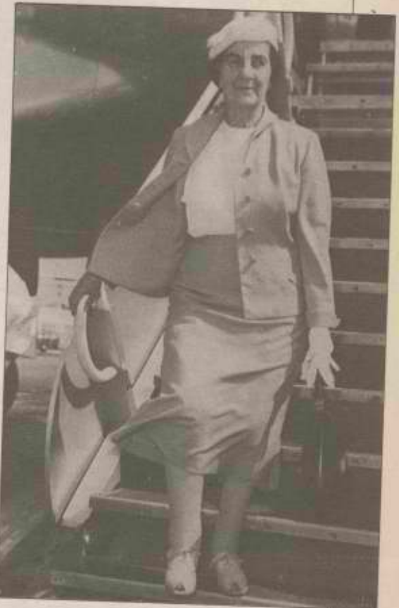
גולדה: "ואם לאשה נשואת אין חברות אינטימיות, האם זה מוכיח שהיא הוגנת יותר אהבה לבעלה?"

(המשך מהעמוד הקודם) כשקט לאולם והצטנפו כפינה חשוכה. אחרי שאמא עלתה לבמה ודיברה הרבה זמן, מחאו לה הילדים כפיים יחד עם כל האנשים באולם. אחר כך ערכבה הצבעה. כל ילד הרים שתי ידיים בשביל אמא. וככה זה נשאר כל החיים. יהודית שמחוני: "אנחנו עסקנו הרבה בנושא של קריירה במשפחה. היא לא היתה כזה, היתה לה הרגשה ברורה של ייעוד, לא היתה לה בעית התלבטות. היו לה אמנם בעיות עם הילדים, אבל אף פעם הקריירה לא עמדה להכרעה מול המשפחה. היה ברור לגמרי שלא התאימה להי משפחה סטרייט". כמה שורות ממאמר שכתבה גולדה בעילום שם: "ואם אמנם אשה נשואת עם ילדיה ואינה מתמסרת לשום דבר אחר, האם זה באמת מוכיח שהיא מסורה יותר מן האמהות מן הסוג השני? ואם לאשה נשואה אין חברות אינטימיות, האם זה מוכיח שהיא הוגנת יותר אהבה לבעלה?" שרה'ה מאירסון היתה ילדה חולנית. באחת הנסיעות של גולדה לראה"ב, התמירה המלה. היום אמרת הבת: "היא היתה נוסעת ומשאירה ילדה חולה מאוד לחודשים ארוכים. זה לא הפריע לה לנסוע. היום אני לא מבינה איך עשתה את זה, אני את הילדים שלי לא הייתי עוזבת".