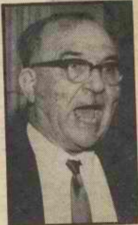
לוי אשכול שעה 9:30