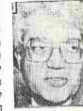
השר דוד לוי