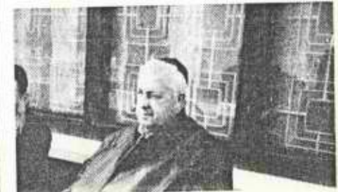
יעון בדרך לפולין