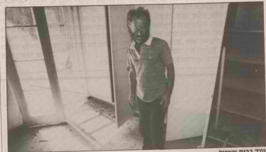
נווד בבית אשכול

מסתייגת עם זאת מהקמת מרכז תרבות במבנה, שהוצאות רכישתו ושיפוצו גבוהות. הסבת הבניין למתנ"ס כרוכה גם כשינוי החלטת ממשלה, שכאמור יעדה את הבניין ליד לוי אשכול. על רקע זה החליטה הוועדה להנצחת