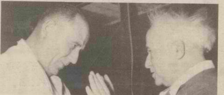
יוסף אלמוגי ובן-גוריון.

אשכול ניסה שוב לשכנעני כי נמצב שנוצר, עדיף שלא ללכת לבחירות, וכי אם מסתמן הסדר המתקבל על דעת הכל, יש לקבלו. אולם אני נשארתי איתן בדעתי.