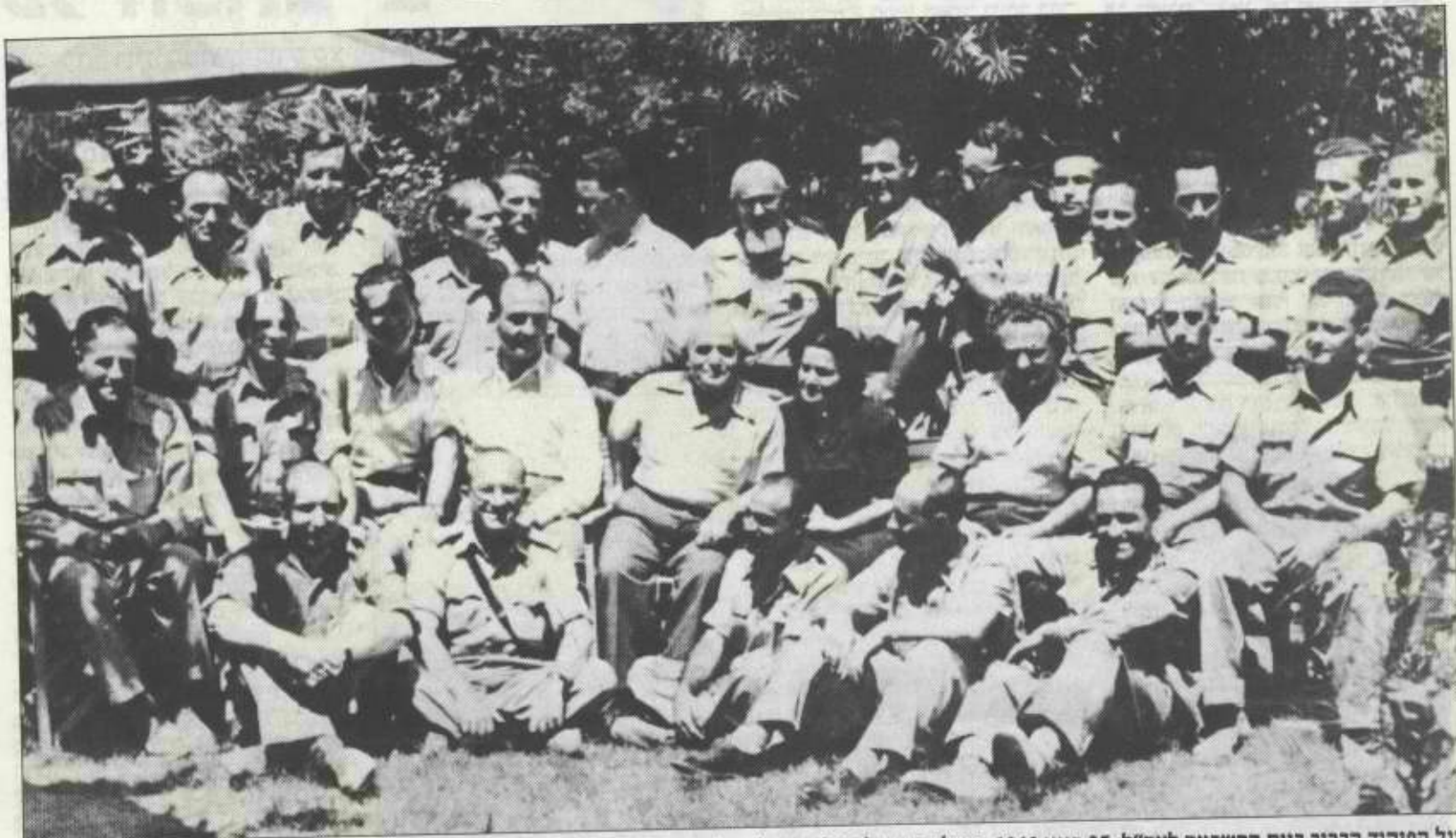
סגל הפיקוד הבכיר ביום ההשבעה לצה"ל: 27 ביוני 1948. בצילום, שצולם על גבעת "החלמה" ברמת-גן עליה שכן המטכ"ל, מופיעים ראשי אנפים במטה, ממקדי חטיבות ועוזריו של בן-גוריון (ראה גם מסגרת בעמ' 47)