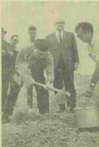
לוי אשכול בטקס חנוכת מצודת היערנים ביתר

וברצוני לומר קצת דברים על "אשכול כמנהיג", אילו היו מציגים לי את השאלה, אפשר שהייתי תמה — "מנהיג? מנהיג אינו הואר סתם מעין דוקטור, פרופיסור או מלך, "מנהיג" בלשוננו שורשו "נהג"; טוב האיש לוי אשכול, מאז בואו, לא נהג לקראת פעולות ומעשים, האם לא הניח יסודות ומפעלים בעלי דרגה ראשונה ועמד בראש המדינה שלנו? האם כל מעייניו לא היו נתונים להשרות שלום, לזרוע הבנה הודית ולהלך רוח טובה? עצם העמידה בראש לפני מלחמת ששת הימים וההתיר