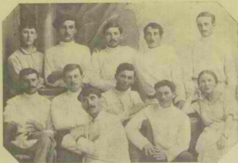
עם קבוצה „עבודה“ שנת 1917. אשכול בשורת העומדים, שני משמאל.

בזמן גילוי חלוט מעל אנדרטה לשלושה, שחוקמה בקיבוץ עינות, לזכרם של השלושה שהתנדבו אז להוסיף לפני השלטונות התורכיים. ואשר לא חזרו מכלא דמשק, סיפר לוי אשכול ז"ל זכרונות מאותה התקופה לפני כל הנאספים וביניהם נשיא המדינה, יצחק בן-צבי ז"ל, ורעייתו רחל, תיבדל לחיים ארך כיום. צר מאוד, שהדברים לא נרשמו אז, ולא הסתיר הדבר גם אחר כך, כי היה בהם ענין רב לחיאורה של אותה תקופה של חיינו בארץ.