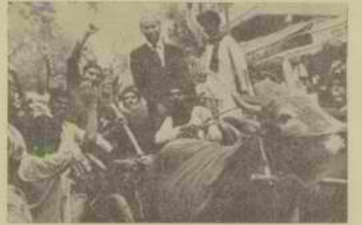
בוהוטור לאחר שוחרר ממעצרו

נורלה של פאקיסטן ייחתך בתקופה הקרובה במאבק המתנהל בין כוחות הקידמה, בהנהגת זולפיקר עלי בודה סור, ובין הכוחות השמרניים, בהנהגת מרשל חיל-האוויר אגהור חאן, המרשל, אם מכות עצמו אם מתוך תיאום עם איוב חאן, מסקדו הצבאי משך כל השנה, אילגן ברוינות מדהימה כוח מדיני אודם, שעשאו למתנגד רציני של מנהיגי השמאל הדמוקרטי ז.ע. בוחטור, מנהיג זה נישא בחודשים האחרונים על גלי ההתלהבות החמונית ורשם לזכותו את נסיגת איוב חאן מהשלטון, אולם המרשל אגהור חאן ריכז במחנהו את הכוחות הסוציאליים, שיש להם מה לאבד", ומשום-כן מעוניינות בתמשך הסדר והשקט הסוציאלי-מדיני בפאקיסטן, הוא מבסס גם את כוחו הפוליטי על המערכת השלטונית, שהקים איוב חאן, ונשארה נאמנה לשלטון במידה רבה מפתח מפני יום המחר, השכבות החברתיות העירויניות, המוסטיות ובעלי הקרקעות הגדולים, ערדם וזכרים את תקופת המהומות ומאורעות הדמים מלפני עלות איוב חאן לשלטון, ולכן הם רואים במרשל אגהור חאן ארט חוק שיבטיח את הסדר, לא יחדרו להמשיך ברפורמה החקלאית ויחד עם זה יפעל כנשיא נבחר — אם ייבחר — לפתרון הבעיות הבוררות של פאקיסטן של ידי הכרעות דמוקרטיות של העם ובית הנבחרים, קיימת סברה, שאיוב חאן מתכוונ להעביר למארישל את השלטון בתקופה המעבר, שבה יתקיימו הבחירות הפרלמנטריות וכך יירדה שתי ארנבות