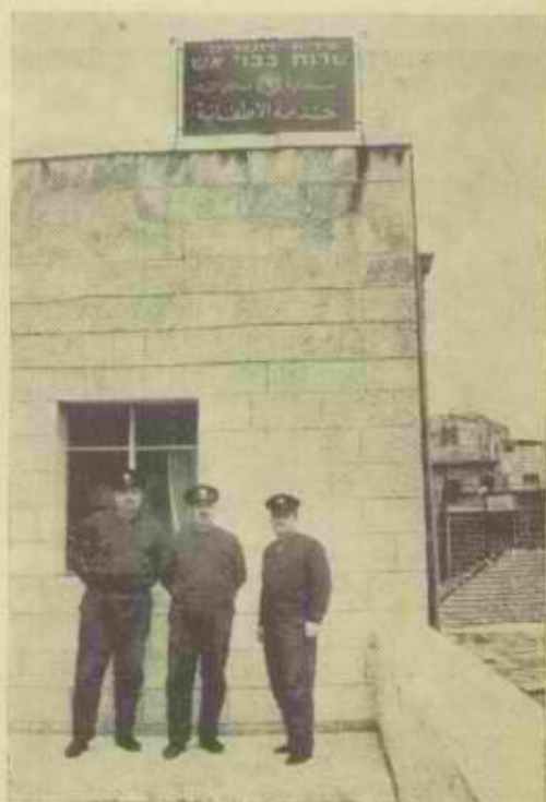
הכניסה לתחנת מכבי-אש במזרח ירושלים

יש לציון בדאגה ומורת רוח את התרופפות המשמעת הארגונית בשנים האחרונות בקרב העובדים במקטורים שונים המבקשים להגדיל את משכורתם ותנאי עבודתם בדרך של שבתות פראיות, הרף החלטה ההסתדרות על הקפאת השכר עד סוף שנת 69, טרם להעלאה הכרוכית בהגברת הפריון התפוקה, מקרה המור של הפרת כל סדרי הארגון הקיימים, תוך איציות למרות ההסתדרות, קבלנו בימים אלה מאת עובדי המשמרות בחברה החשמל בדרום, הללו שאינם מקופים כלל וכלל בשכרם, כפי שפורסם בעתוננים, החליטו, כי השעה כשרה לדרוש העלאה נוספת, והשתמשו באמצעים, שלדעת הממשלה היה בו כדי לסכן את אספקת החשמל הסדירה, ולפגוע בצידו הסמני היקר, הם לא נענו לישום תביעה לחזור לעבודה תקינה ולמנוע