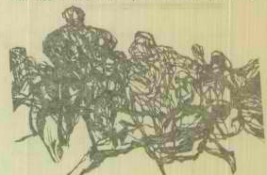
חיתוך עץ מתערוכת האומנות הפינית

האוסנות הגראפית מוכרת לנו עוד מתחילתו של הצירי החשוב הגרמני דויר, הוא העלה את תחילתו לרמה חשובה. אחריו באו תחילתו של רמברנדט, וכן ציורים אחרים בני תקופתו. גם בתחילתו רמברנדט נמצא את הפרטים החשובים, שיש ביצירותיו האחרות, במשך הזמן נשכחה דרך ביטוי זה, ורק לפני כעשרים שנה חזרו