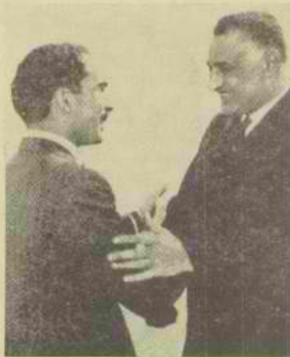
גינוני נאצר כלפי חוסיין

בהשמיעו דברים אלה בירדן, עושה — איפוא — המלך יד אחת להשלמת תורתו של הייכל אשר הועלתה ב"אל-אחראם" מיום 7 במרס, בה טען, כי הערבים יוכלו לאבד 50,000 איש למען הגשמת כוונתם לנצח את ישראל, את בכירי הקרבנות ב"מאבק זה, מקדש גם המלך חוסיין: ערב צאתו ל"